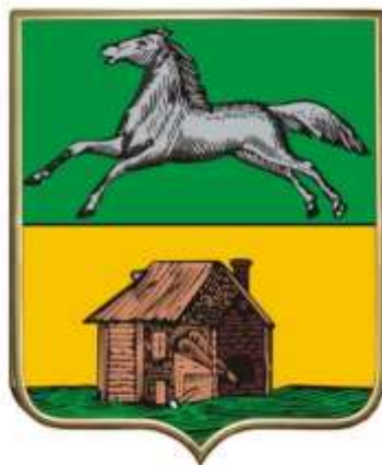
СХЕМА ТЕПЛОСНАБЖЕНИЯ В АДМИНИСТРАТИВНЫХ ГРАНИЦАХ ГОРОДА НОВОКУЗНЕЦКА НА ПЕРИОД ДО 2032 ГОДА (АКТУАЛИЗАЦИЯ НА 2025 ГОД)